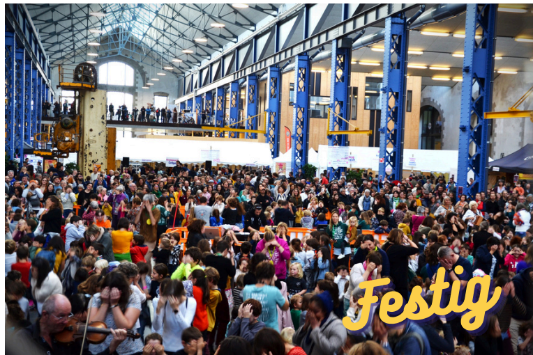
Le fest-deiz pour les enfants