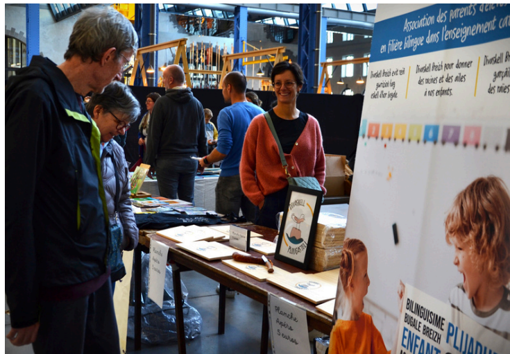
Les stands des assos :

Sked, Diwan Brest, skolaj Diwan, Divyez Ar c'hevredigezhioù